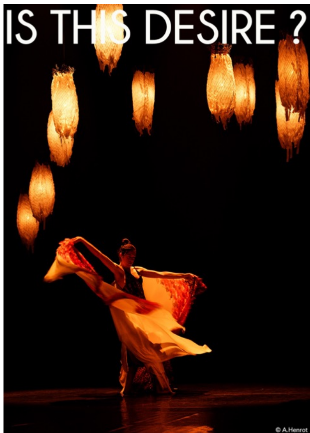
Is this desire ?: danse 60 mn